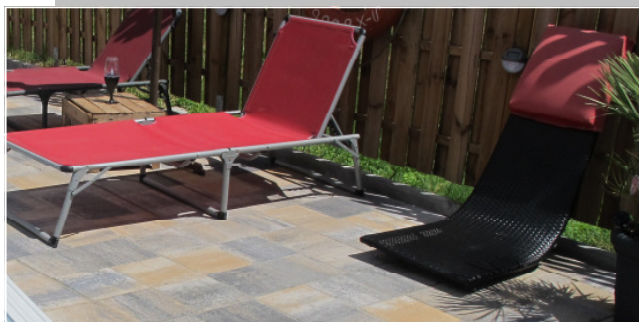
ACERA Terrassenplatten Farbe: muschelkalk