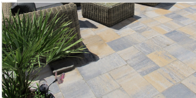
ACERA Terrassenplatten Farbe: muschelkalk

mit besonders feiner Oberfläche, Imprägnierung und Microfaser